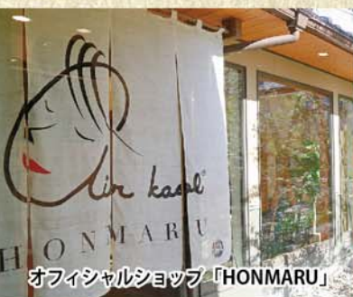
オフィシャルショップ「HONMARU」